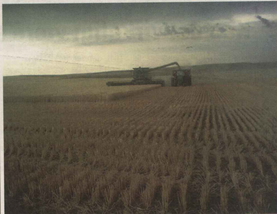
Søren fik opfyldt drømmen om at køre med store maskiner.